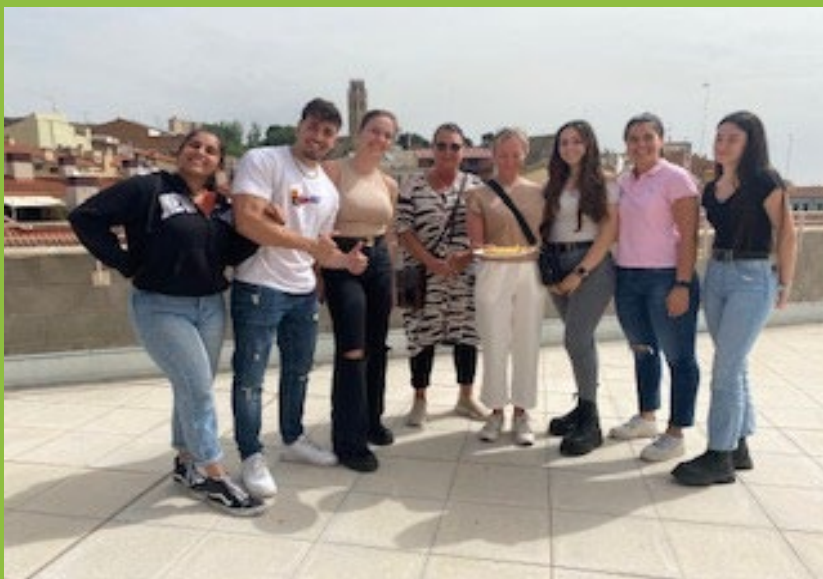
Temalektion "ägg", vinnare av "spansk tortillatävling"