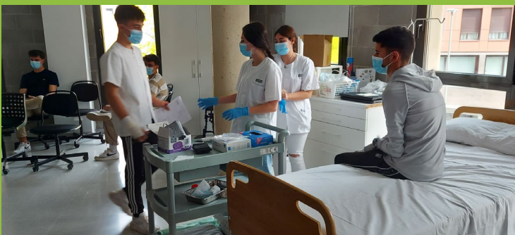
Metodövning i klassrum. "Coronatest"